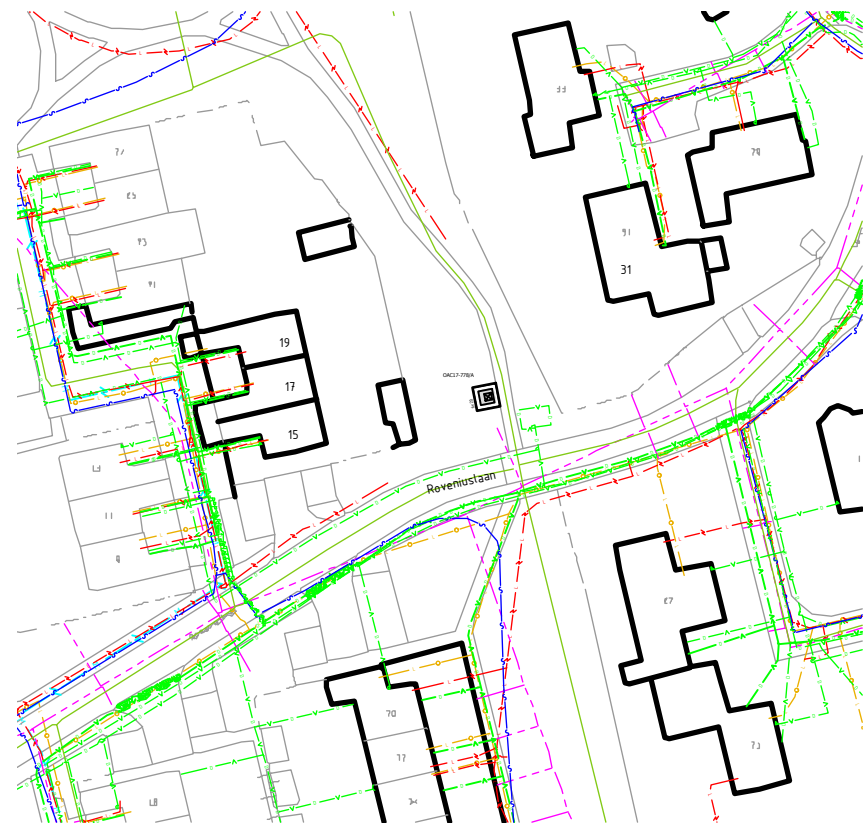
Overzicht aansluitingen Schaal 1:1000