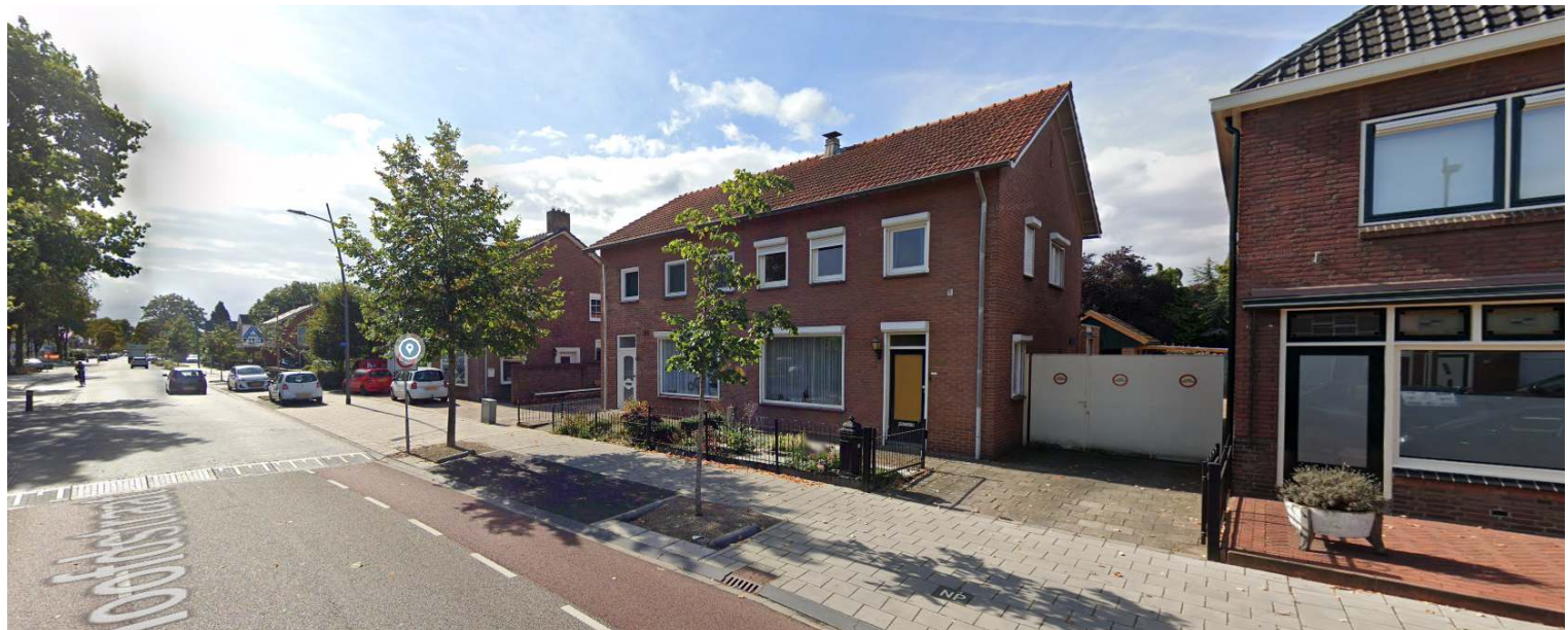
Straatbeeld bestaande, aangrenzende bebouwing

De vorm van de kap en de richting van de kap is in principe vrij onder de voorwaarde dat deze vorm en richting de hoofdvorm van de nieuwbouw versterkt. De kap mag afgeknot zijn, waardoor deels een platte afdekking ontstaat, onder de voorwaarde dat dit niet ten kosten gaat van de uitstraling van de kap. Een volledig platte afdekking van het hoofdgebouw is echter uitgesloten. Daar waar bijgebouwen zijn aangebouwd aan de woning moet er samenhang zijn met de kapvorm van bijgebouw en hoofdgebouw. Het hoofdgebouw ligt met de voorgevel in de rooilijn.