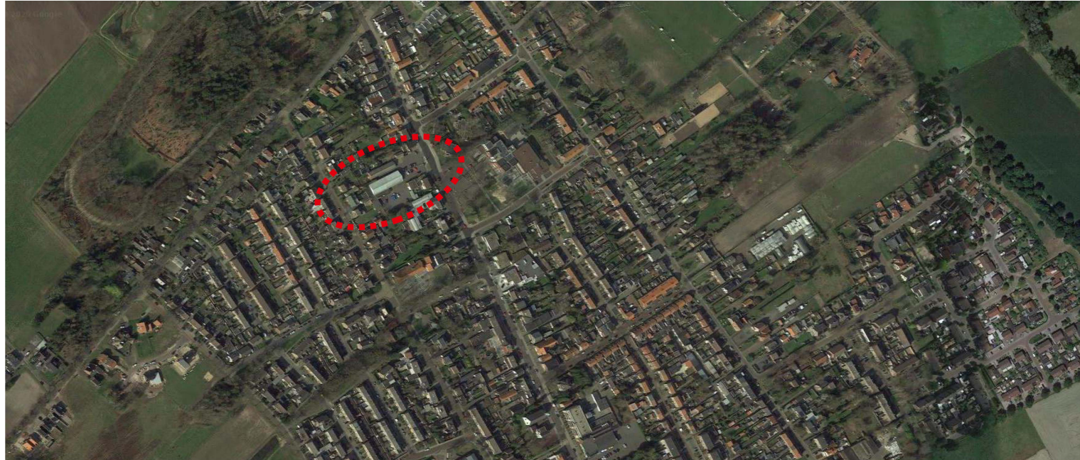
Overzichtsfoto van het plangebied

In het bestemmingsplan 'Aldi Overdinkel' wordt de mogelijkheid geboden voor het realiseren van een appartementengebouw met 10 gestapelde woningen (appartementen). Als algemeen uitgangspunt wordt nagestreefd dat de nieuwbouw een architectonische kwaliteit heeft die aansluit bij de kwaliteit van de aangrenzende bebouwing in het lint van de Hoofdstraat. Om deze kwaliteit te bereiken zijn in dit beeldkwaliteitplan randvoorwaarden, als bindende uitgangspunten, uitgewerkt en omschreven.