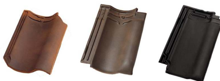
Donkere keramische dakpannen