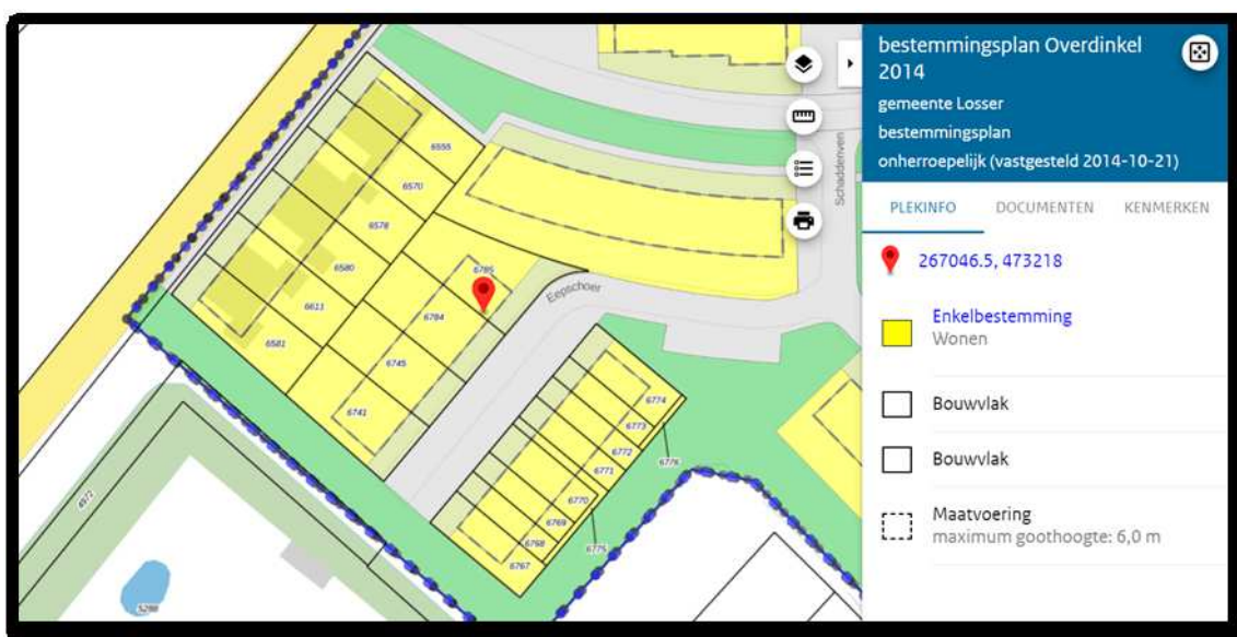
(Afbeelding 1: Verbeelding van het bestemmingsplan op de locatie Eepschoer 2 in Overdinkel)

De werkzaamheden vinden plaats in een gebied waarvoor het bestemmingsplan "Overdinkel 2014" is vastgesteld. De werkzaamheden vinden plaats op gronden met de enkelbestemming "Wonen", e.e.a. volgens artikel 22 van het plan (zie afbeelding 1).