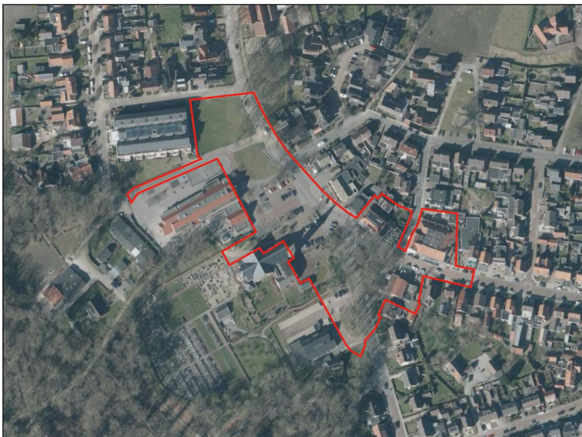
Afbeelding 2.1 Luchtfoto huidige situatie plangebied

Het plangebied heeft grofweg betrekking de gronden tussen de hoek Boerrichterstraat – Plechelmusstraat en de hoek Irenestraat – Dorpsstraat. In het plangebied bevinden zich functies die passen bij een centrum, denk hierbij aan pleintjes, parkeervoorzieningen, terrassen en groen. De Plechelmusstraat loopt centraal door het plein heen. Ten westen van deze bevinden zich de Sint Plechelmuskerk (gemeentelijk monument) met pastorietaan, de Plechelmusschool met de bijbehorende pleinen en het nieuwe gezondheidscentrum (Plechelmusstraat 1). Aan de oostzijde van het plein bevindt zich de bebouwing van de centrum- en horecavoorzieningen van het centrum. In afbeelding 2.1 is een luchtfoto van de huidige situatie weergegeven. Het plangebied is hierop rood omkaderd.