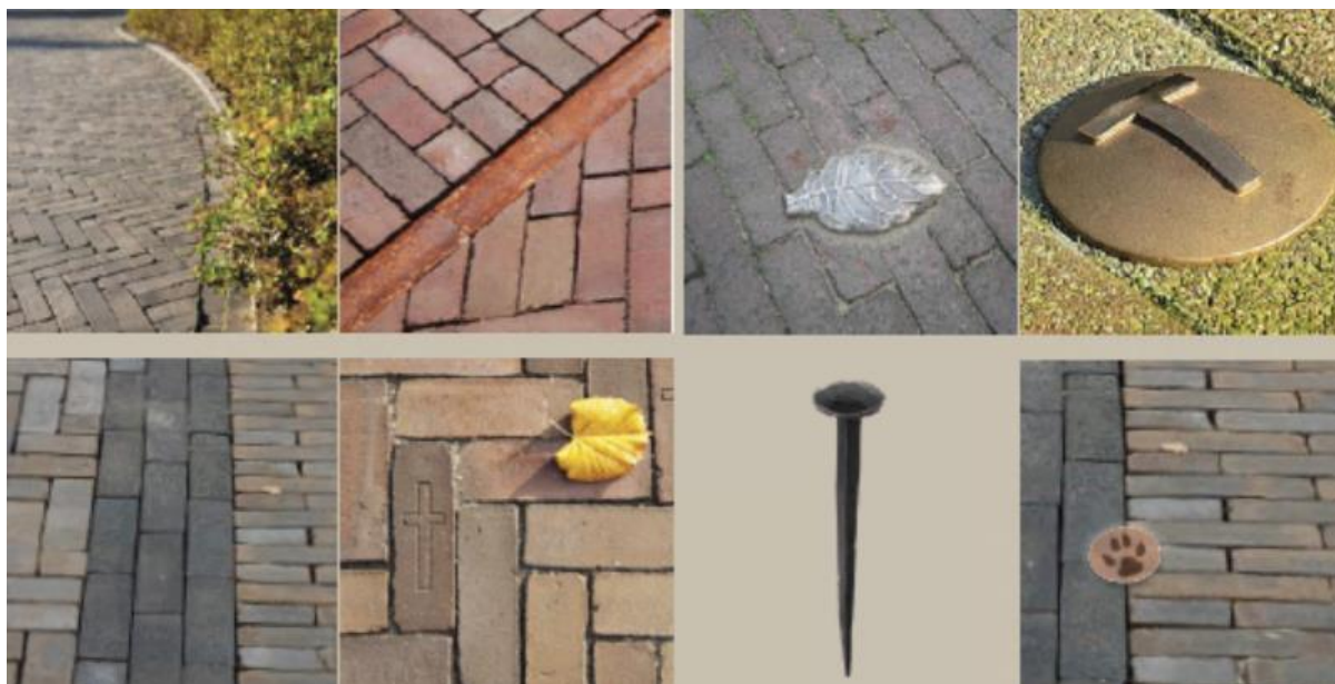
Afbeelding 3.1 Inspiratiebeelden overgangen