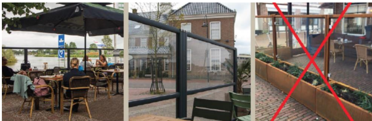
Afbeelding 3.3 Inspiratiebeelden elementen