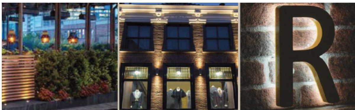
Afbeelding 3.5 Inspiratiebeelden verlichting

Verlichting is een belangrijk onderdeel van de sfeer en uitstraling in het centrum. Een goede balans hierin is belangrijk. Naast de openbare verlichting worden belangrijke gebouwen als de kerk, school en Erve Boerrigter uit- en aangelicht. Daarnaast worden enkele objecten in de openbare ruimte uitgelicht zoals de Hellehond en straks de dorpspomp. Om hierin een juiste balans te creëren wordt een verlichtingsplan voor de openbare ruimte opgesteld. Ook moet de verlichting in de openbare ruimte aan bepaalde eisen voldoen voor een sociaal veilige en verkeersveilige openbare ruimte.