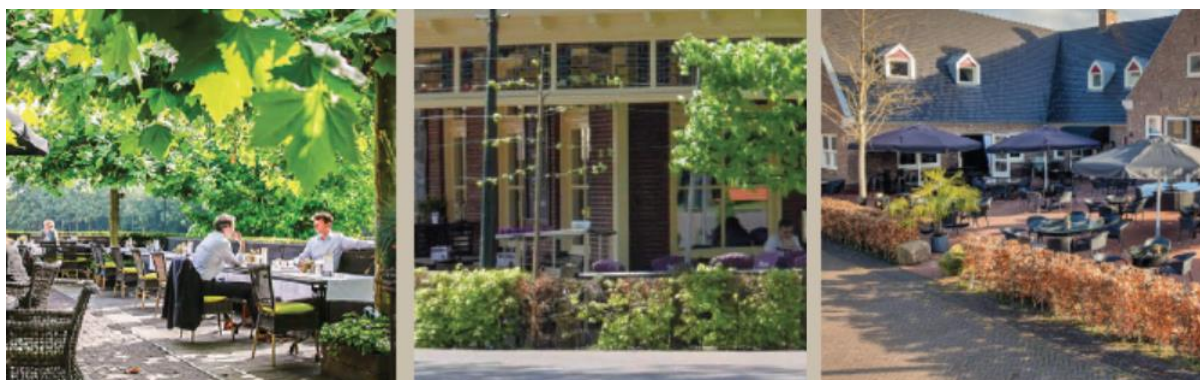
Afbeelding 3.4 Inspiratiebeelden meubilair & beplanting

De beplanting in het centrum van de Lutte is belangrijk om de lommerrijke en gastvrij uitstraling te versterken. Beplantingen verhogen niet alleen de ruimtelijke kwaliteit maar dragen ook bij aan de thema’s als biodiversiteit, klimaatadaptatie en beperken van hittestress.