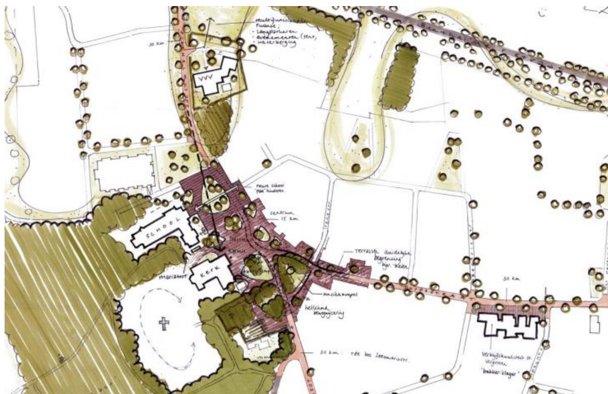
Afbeelding 4.1 Uitsnede visiekaart

ruimtelijke kwaliteit toe te voegen. Deze vormgeving gaat uit van de ‘shared space’ gedachte waarbij de harde scheidingen van verkeersdeelnemers grotendeels worden losgelaten. Door de vormgeving van het plein blijft de snelheid op het plein laag. In afbeelding 4.1 is ter indicatie een uitsnede van de visiekaart opgenomen.