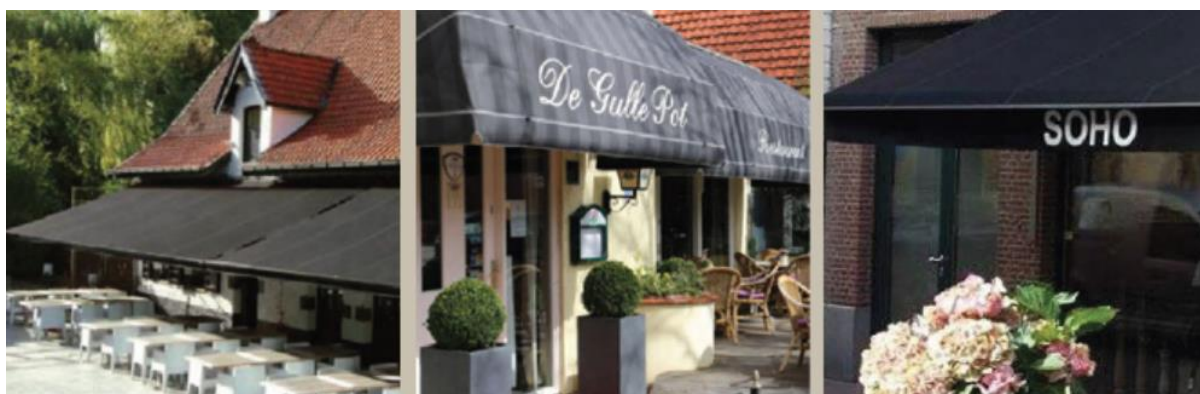
Afbeelding 3.2 Inspiratiebeelden gevels

De gevels zijn de ‘gezichten van het dorp’ en dragen bij aan een gastvrije uitstraling van het centrum. Elementen die op, aan of tegen de gevels worden geplaatst dienen hieraan bij te dragen. Zonwering is hierbij vaak een beeldbepalend onderdeel. Zonwering en markiezen kunnen met ingetogen kleurgebruik in een repeterende kleurstelling rust brengen in het straatbeeld.