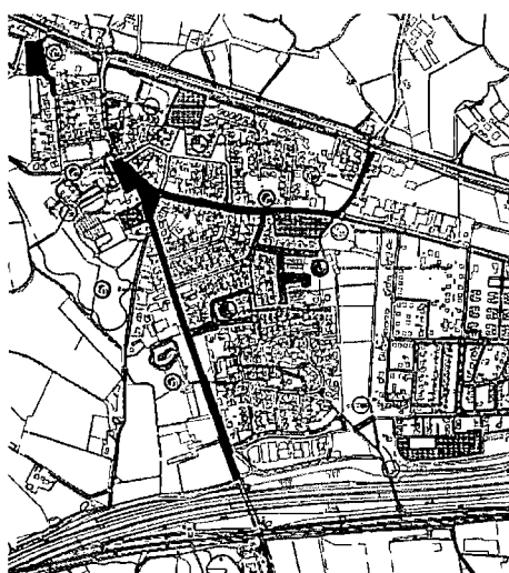
MIP-kaart 21 juni 2016 (thema-bijeenkomst raad en cie. Ruimte)

Vertrekpunt is het MIP (integraal meerjaren investerings- en onderhoudsprogramma voor de openbare ruimte). Het geactualiseerde MIP (zie bijlage 12), met daarbij de input voor de kadernota 2017 t/m 2020, is op 21 juni 2016 toegelicht tijdens een themabijeenkomst voor leden van de raad en commissie ruimte.