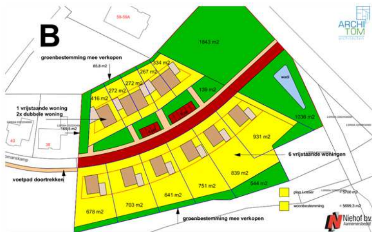
Verbeelding van het wenselijke eindbeeld (bron: Nihof BV).

Het concrete voornemen bestaat om 11 grondgebonden woningen te bouwen in het plangebied en een ontsluitingsweg aan te leggen tussen Beuningerstraat en de bestaande ontsluitingsweg Lomanskamp. Aan de oostzijde van het plangebied wordt 1842 m 2 beplanting aangelegd en wordt een wadi gegraven. Om de bouw van de woningen mogelijk te maken worden een bestaande greppel gedempt en worden enkele zomereiken geroid. Op onderstaande afbeelding wordt het wenselijke eindbeeld weergegeven.