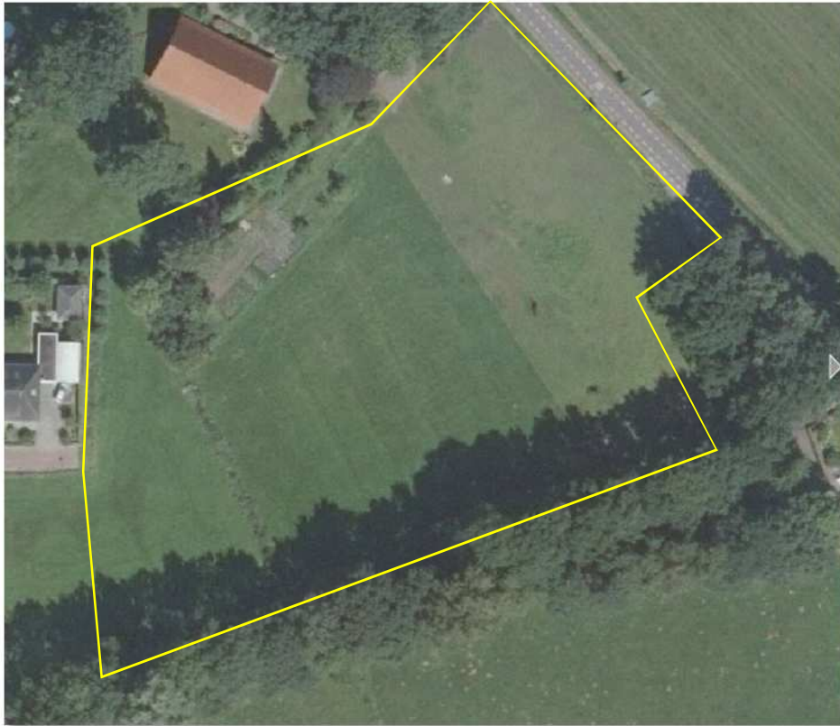
Detailweergave en begrenzing van het plangebied.