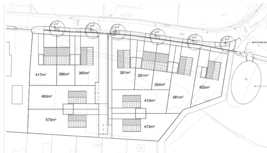
Verbeelding van de wenselijke ontwikkeling in het plangebied.

Het voorgenomen plan bestaat uit de sloop van alle bebouwing in het plangebied en het kappen van enkele bomen om het gebied vervolgens bouwrijp te maken voor de nieuwbouw van 12 grondgebonden woningen. Naast sloop en nieuwbouw, wordt er een wadi ten oosten van de woningen gegraven. Op onderstaande afbeelding wordt de nieuwe wenselijke situatie weergegeven.