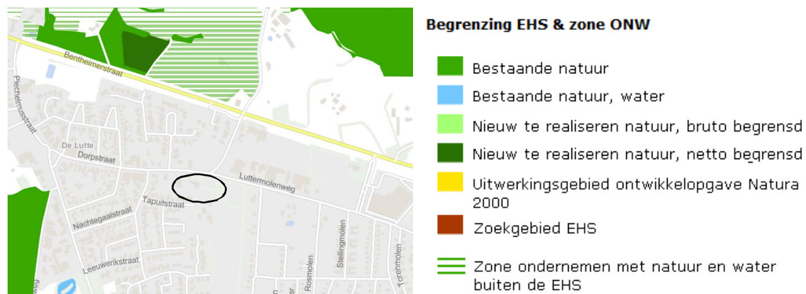
Ligging van de EHS nabij het plangebied. Het plangebied wordt met de zwarte ovaal aangeduid.

Het plangebied ligt niet in de EHS. Gronden die tot de EHS behoren liggen op minimaal 300 meter afstand van het plangebied. Op onderstaande kaart wordt de ligging van de EHS in de omgeving van het plangebied weergegeven.